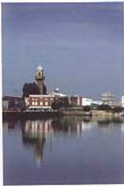
La tour des Dockers