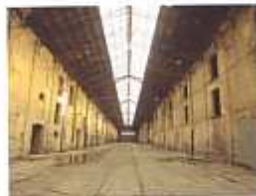
Les Docks Vauban

Vélos non fournis. Les enfants de moins de 10 ans doivent être accompagnés.