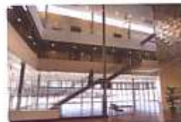
La Chambre de Commerce et d'Industrie