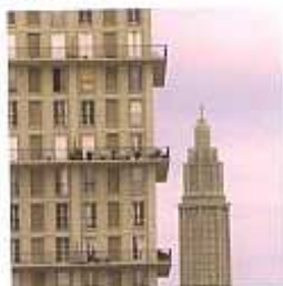
Tour IGA et église Saint-Joseph

Partez à la rencontre de quelques édifices au cœur de la «ville monumentale» construite par Auguste Perret : la Porte Océane,