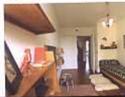
La chambre des enfants de l'appartement Perret

RDV 1, place de l'Hôtel de Ville (à l'extrémité de la rue de Paris)