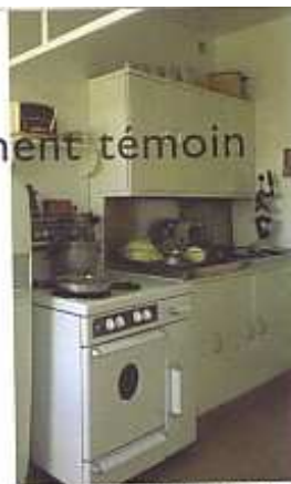
La cuisine de l'appartement témoin Perret