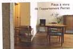
Place à vivre de l'appartement Perret

Après une rapide présentation des immeubles réalisés par l'atelier d'Auguste Perret, visitez un appartement aménagé selon les principes des années 1950.