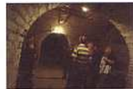
Batterie de Dollemard

RDV à la Batterie de Dollemard (accès par l'escalier au 55, rue Jean Bart à Sainte-Adresse)